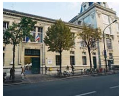
Le campus de Paris