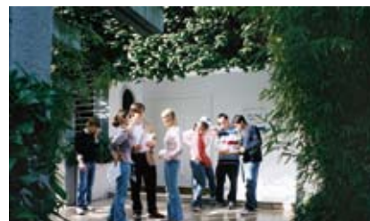
Le campus de Madrid