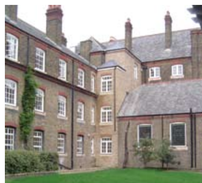
Le campus de Londres