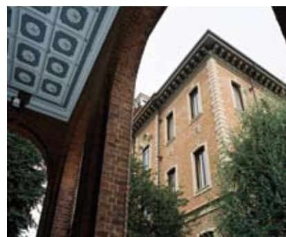
Le campus de Turin