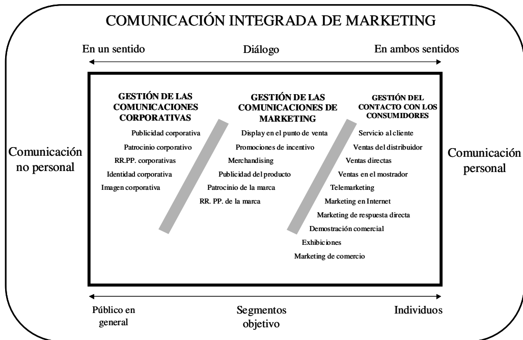
Figura 1. Marco adaptativo de la IMC

Por otra parte, en este nuevo contexto comunicacional que supone la integración de las disciplinas de comunicación, se plantea como algo necesario la reforma de la taxonomía tradicional usada para hacer referencia a las distintas actividades, ya que es difícil situar en las distintas categorías establecidas ciertas actividades como el product placement o las exhibiciones (Pickton y Hartley, 1998). Hartley y Pickton (1999) desarrollan un marco adaptativo de IMC para salvar las limitaciones de la terminología tradicional donde engloban este tipo de actividades (véase figura 1).